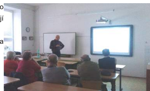
Školení řidičů v loňském roce

Připravte si případné dotazy, co Vás zajímá ohledně provozu na komunikacích.