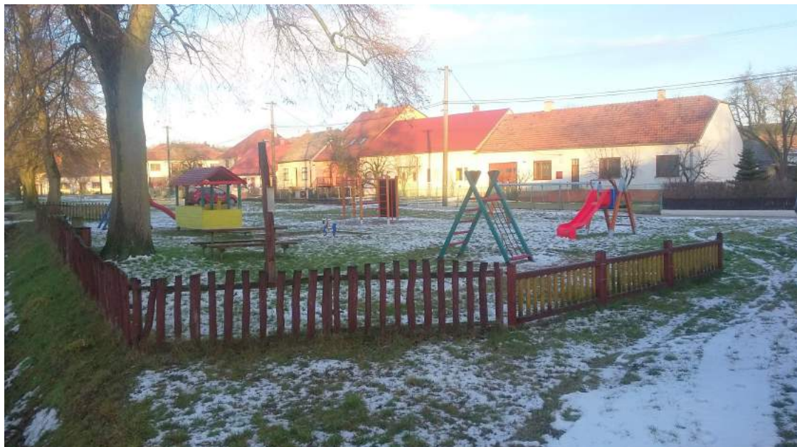
Dětské hřiště na kterém bude letos pokračovat rekonstrukce

V průběhu minulého roku jsme žádali o finanční prostředky prostřednictvím dotačních titulů v mnoha projektech. Z těch získaných jsme obdrželi 100 tisíc korun na neinvestiční úroky z úvěrů, 32 tisíc jsme obdrželi na Višňovské kulturní léto, 7 a půl tisíce na zásahy jednotky SDH. Z Ministerstva pro místní rozvoj jsme na dovybavení dětských hřišť obdrželi 230 tisíc. Na opravy oplocení z Asekolu 25 tisíc. Na stavební práce hasičské zbrojnice jsme dostali 300 tisíc.