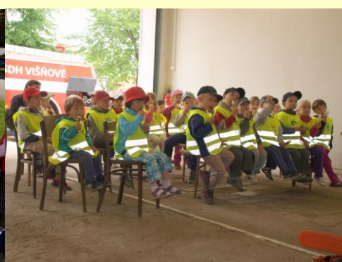
Mateřská škola v hasičárně