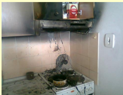
Požár v DPS

Bližší informace o konaných akcích, ale i o zásazích při požárech najdete na webu: hasici.visnove.cz