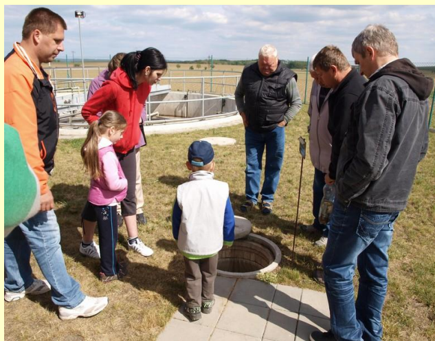
Den otevřených dveří - ČOV