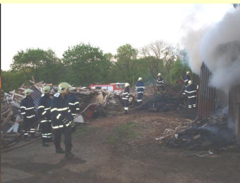
Požár v parku