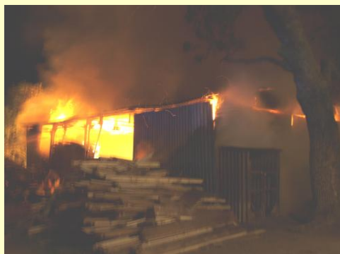
Požár v parku