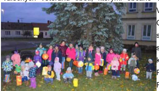
Lampionový průvod, který pro děti připravily višňovské maminky