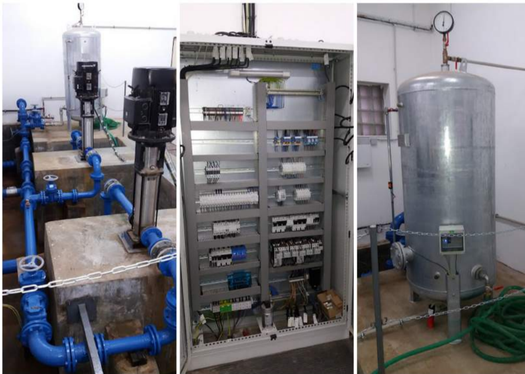
Zrekonstruovaná vodárna u vinohradu