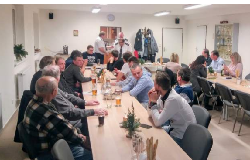
Výroční valná hromada SDH Višňov konaná dne 9. 12. 2017