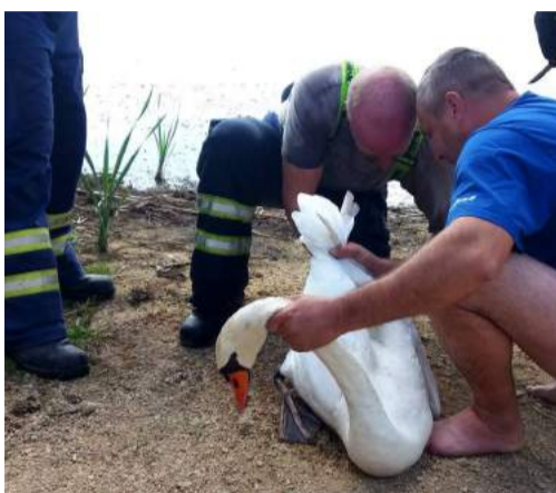
Záchrana labutě zamotané do vlasce

14.08.2017, 20:07:43 - TECHNICKÁ POMOC – LIKVIDACE OBTÍŽNÉHO HMYZU – TVOŘIHRÁZ 29.08.2017, 14:31:27 - TECHNICKÁ POMOC – ODSTRANĚNÍ STROMU – VÍTONICE 30.08.2017, 17:57:09 - POŽÁR – POLNÍ POROST TRÁVA – HORNÍ DUNAJOVICE 31.08.2017, 15:32:57 - TECHNICKÁ POMOC – LIKVIDACE OBTÍŽNÉHO HMYZU – TAVÍKOVICE 31.08.2017, 17:00:50 - TECHNICKÁ POMOC – LIKVIDACE OBTÍŽNÉHO HMYZU – ŽEROTICE 01.09.2017, 21:59:09 - TECHNICKÁ POMOC – LIKVIDACE OBTÍŽNÉHO HMYZU – ŽEROTICE 09.09.2017, 18:53:35 - POŽÁR – POLNÍ POROST TRÁVA – SKALICE 14.09.2017, 16:49:49 - TECHNICKÁ POMOC – ODSTRANĚNÍ STROMU – ŽEROTICE 29.09.2017, 14:15:08 - ZÁCHRANA OSOB A ZVÍŘAT – Z VODY – HORNÍ DUNAJOVICE