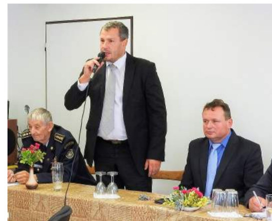
Znojemský starosta Vlastimil Gabrhel