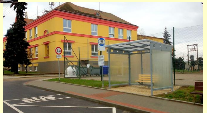
Nová školní autobusová zastávka