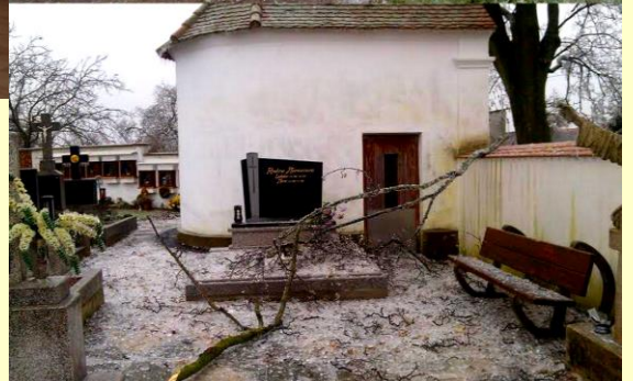
Škody po námraze