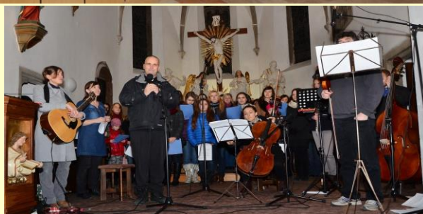
Adventní koncert Marianek