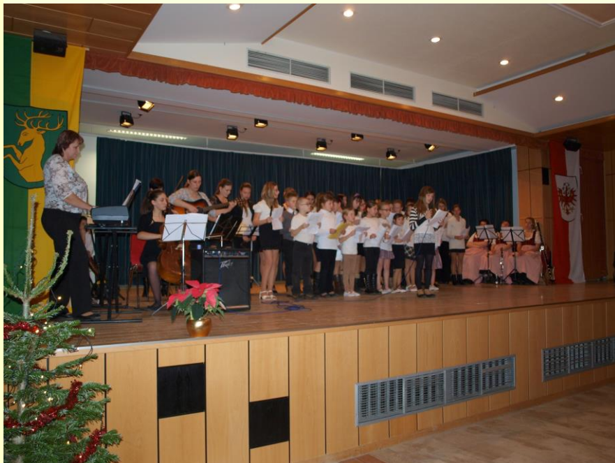
Koncert v Leutaschi

Příspěvky do tomboly budou vybrány do 5. 2. v ředitelně ZŠ a 6. 2. od 9 do 11 hodin ve sportovní hale. Děkujeme.