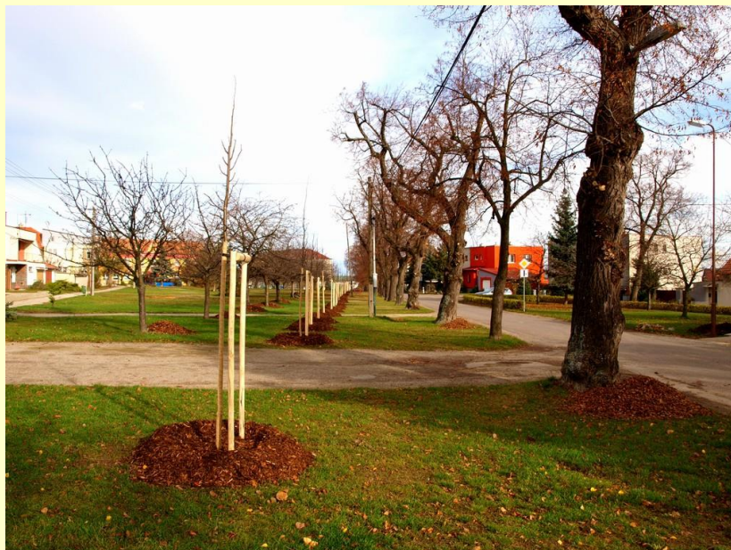
nová lípová alej

Starší a poškozené lípy této aleje by měla nahradit tato nově provedená výsadba. Linie její výsadby v návěsním parkovém prostoru by měla zajistit podmínky pro její honosný vzrůst pro obdiv generací občanů, které po nás přijdou.