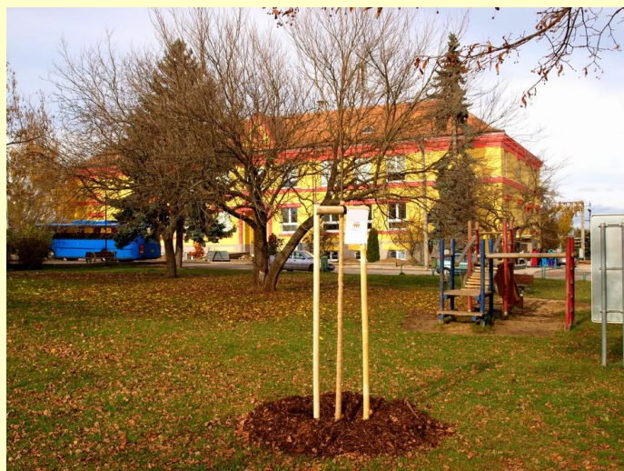
Nově vysazená lípa je součástí lipové aleje před zrekonstruovanou školou