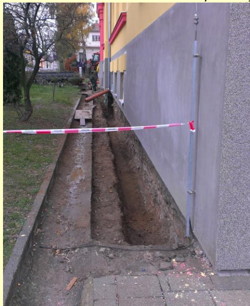
Vlhké základy staré budovy

Po skončení „Komplexního zateplení budovy ZŠ“ se rozjela navazující stavební akce „Dešťová kanalizace ZŠ Višňové II“. V řízení na ni nabídla firma JVS spol. s r. o. nejnižší cenu. V rámci ní provede JVS opatření proti vlhkosti staré části budovy na jižní a západní straně, dešťovou kanalizaci, která bude od čelní části budovy odvádět srážkovou vodu a která bude napojena do kanalizace v zadní části školních ploch. Třetí částí je zbudování parkoviště pro potřeby školy ve směru k fotbalovému hřišti. Jeho využití spatřujeme i při sportovních akcích na fotbalovém hřišti. Sloužit by mělo i jako záchytné parkoviště pro potřeby Nové ulice.