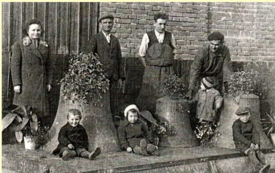
Rekvírování zvonů dne 7. Dubna 1942