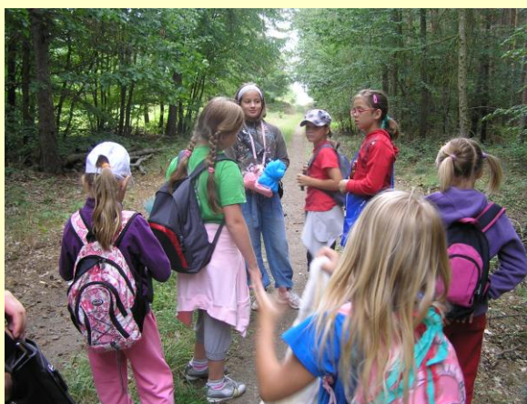
Prázdninový příměstský tábor