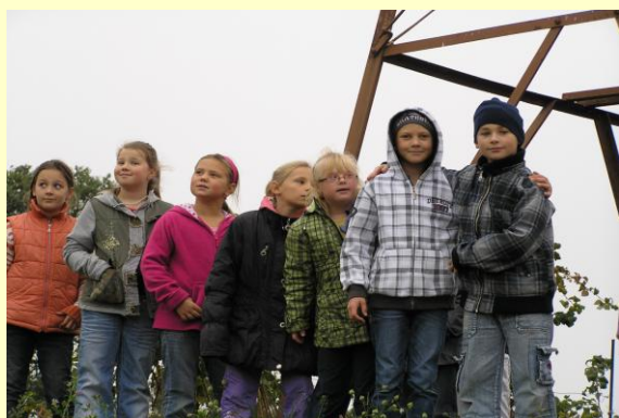
Výuka prvouky v praxi