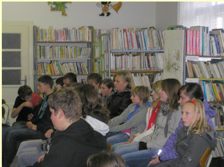
Návštěva v místní knihovně