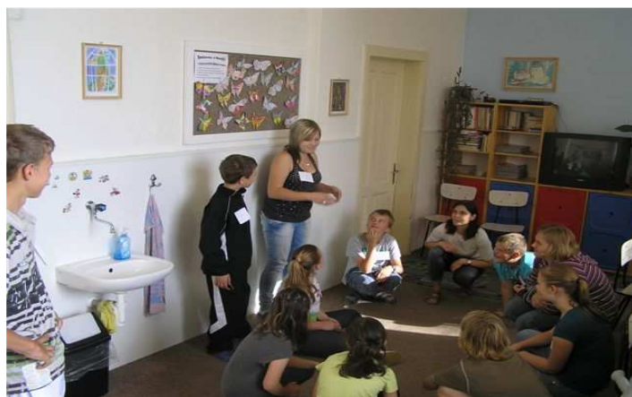
Den proti šikaně

Jídelna Základní školy ve Višňovém sděluje rodičům, že od středy 22. srpna je možno přihlásit žáky základní školy a děti mateřské školy ke stravování na školní rok 2012/2013. Učinit tak můžete telefonicky nebo osobně v kanceláři vedoucí ŠJ a to v době od 8:00 do 12:00 hodin. Žádáme rodiče, aby využívali vchod do jídelny od školního hřiště.